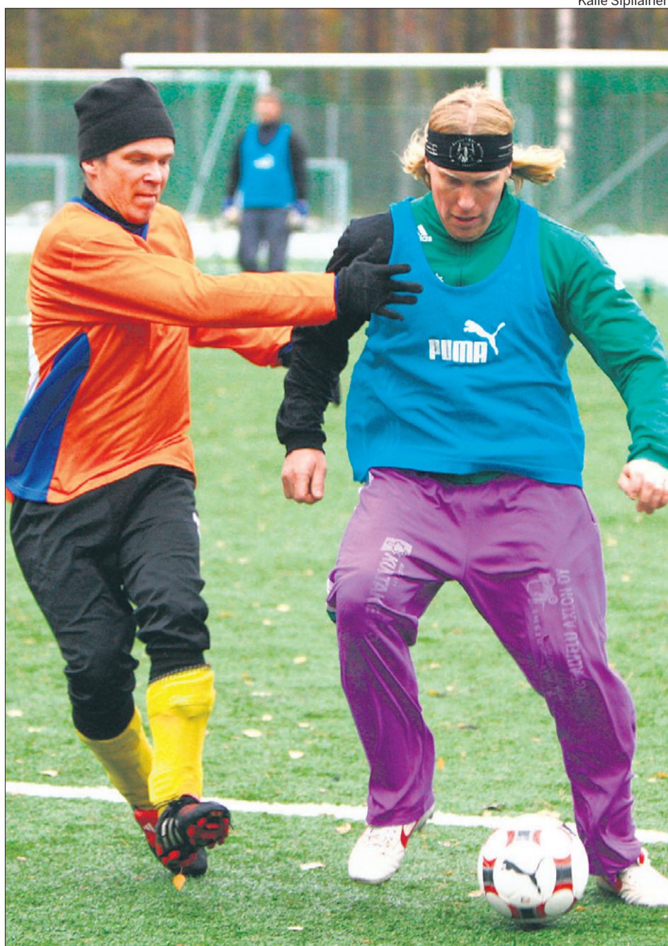
Oranssipaitainen Ovako Bar kohtasi turnauksen ensimmäisessä ottelussaan Omyan.